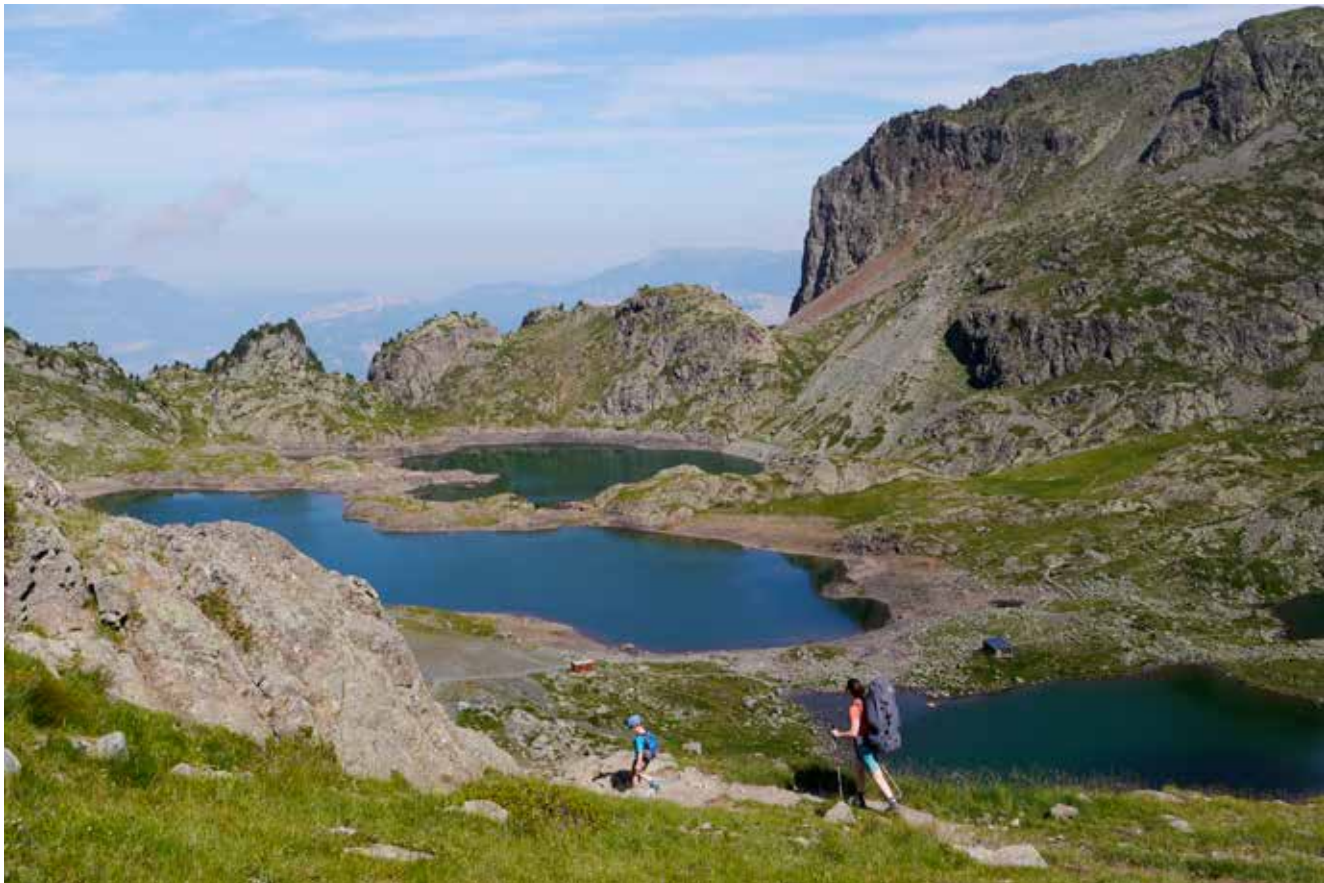
Afdalen naar de Lacs Robert waar we even pauzeren aan de onbemande hut.