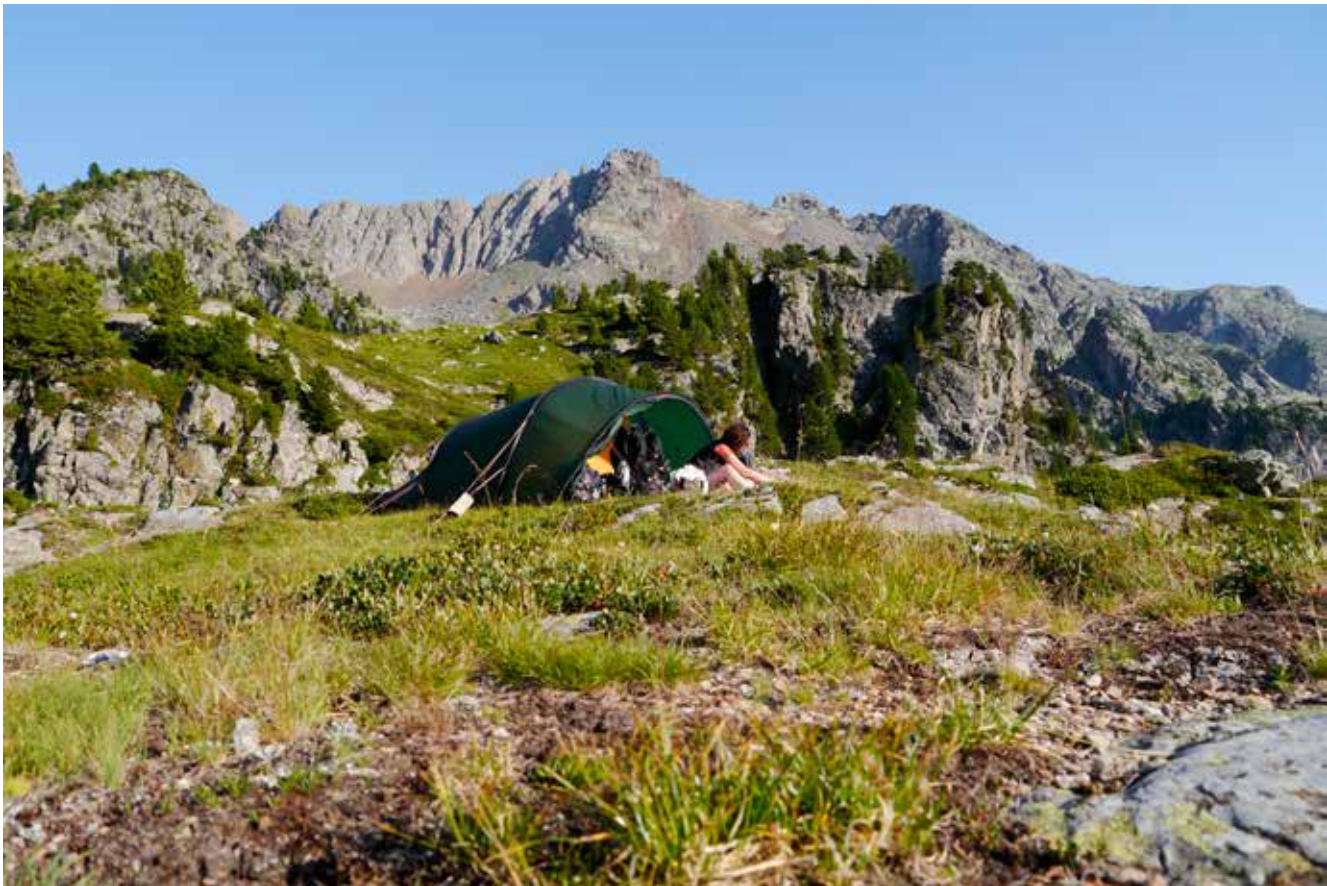
Onze bivakplek is er eentje met een prachtig uitzicht.

in lijn, maar van onze tocht een lus te maken. Nog even gespen we de rugzakken op om een beekje te volgen en vervolgens via GR 549 het Lac Longet te bereiken. Op het eindpunt van het meer kijken we uit naar een bivakplek en we vinden er eentje met een prachtig uitzicht. We spelen wat met de touwen die ik mee heb, bevestigen de stenen nog wat steviger aan de rots en kijken onze ogen uit naar steenbokken. Met de voeten in het water genieten we met volle teugen van de tijd samen. Wanneer we de tent inkruipen, merken we dat we toch niet zo vlak liggen als gedacht en met het gewoel van Louis is het niet makkelijk om in te slapen.